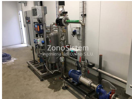
Torres de refrigeración, Francia