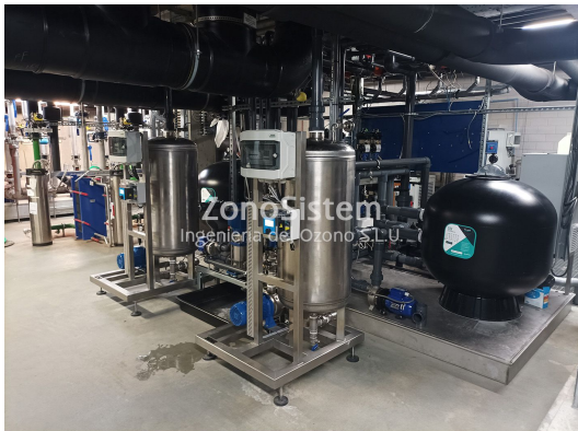
Torres de refrigeración, Bélgica