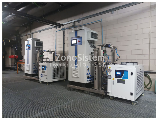
Torres de refrigeración, Países Bajos