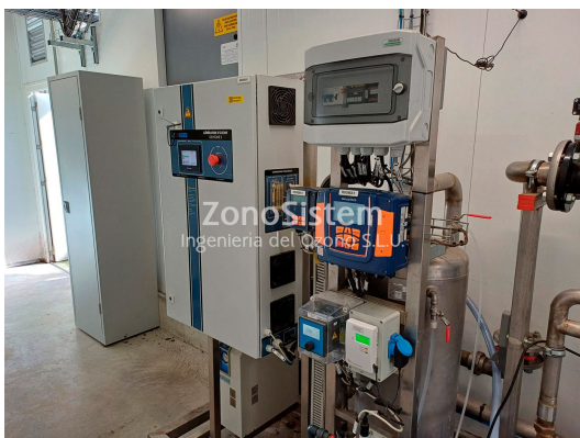
Torres de refrigeración, Francia